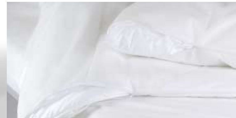
et de systèmes de protection douettes.

En bref: Les lits d'hôtel de sleepfactory*, fruits de la technique moderne confèreront à votre hôtel une très nette avance en matière de qualité de l'équipement des chambres, de confort de couchage pour votre clientèle et d'amélioration de l'efficacité de votre personnel. Vous accroîtrez la satisfaction de vos clients tout en réduisant les coûts dans un domaine cher en main d'œuvre.