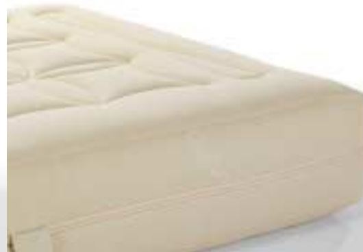
un grand choix de matelas...