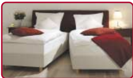
Raffinement: le système de jumelage est fonctionnel et les roulettes à la partie tête du lit facilitent le déplacement.

Le gain de temps est essentiellement dû au système de jumelage des lits. En un tour de main les lits peuvent être écartés du pied ce qui facilite largement le nettoyage et permet un rapide changement des draps. Les lits peuvent tout aussi aisément être séparés à la tête ce qui assure une plus grande flexibilité dans l'utilisation des chambres. Chaque jour vous pouvez passer d'une chambre à lit double à une chambre à deux lits séparés. Ceci vous permettra de n'avoir à refaire qu'un lit si la chambre n'a été utilisée que par une seule personne.