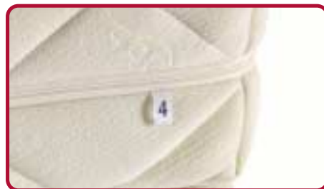
Prévu jusque dans les détails: des étiquettes numérotées aux coins des matelas permettent de s'assurer que le matelas a bien été régulièrement retourné.