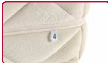
Bis ins Detail geplant: die Nummerierung an den Ecken der Matratze dient als Orientierung beim Wenden