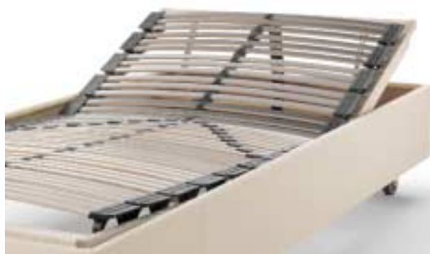
sleep factory*: perfekte Unterfederung...

Unsere Experten für Schlafsysteme beraten Sie gerne ausführlich. Sie verfügen über lückenlose Kompetenz und kennen den Bedarf der verschiedenen Hoteltypen. Gemeinsam mit Ihnen finden unsere Fachleute heraus, welches Bettensystem für Ihr Hotel am geeignetsten ist. Überdies geben sie Ihnen exakte Kalkulationen an die Hand, die Ihnen eine sinnvolle Investitionsentscheidung ermöglichen. Sprechen Sie uns an, wenn Sie zu dem Thema eine wirklich kompetente Beratung wünschen.