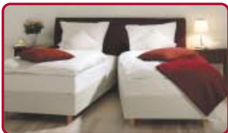
Raffiniert: das Kupplungssystem ist funktional und die Rollen am Kopfende erleichtern die Arbeit